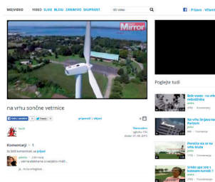
Pasica 300x250 ob videu

Priporočena dolžina oglasa je do 17 sekund, velikost predvajanja je 655x368, največja frekvenca je en prikaz na uporabnika na dan, skupno največ tri prikaze; format oddaje je poljuben (npr. wmv, avi, mpg), oglas se prikaže pred video posnetkom (preroll).